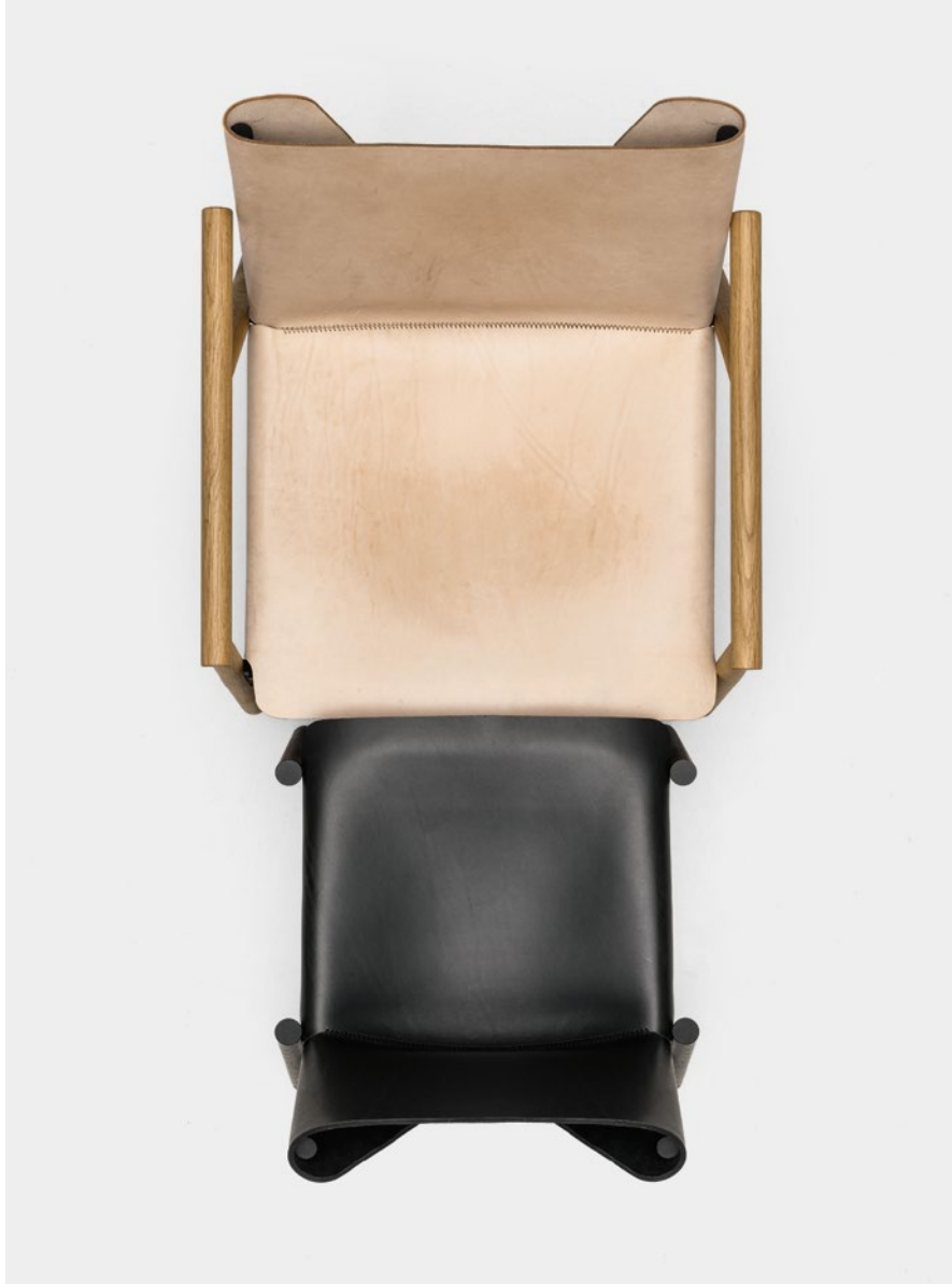
1085 Edition lounge armchair Natural full-grain hide body