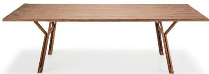
Table with a solid walnut structure with burnished brass details. Top in walnut veneer.

Tavolo con struttura in massello di noce con dettagli in ottone brunito. Piano in tranciato di legno di noce.