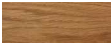
ROVERE · OAK · EICHE · CHÊNE · ROBLE