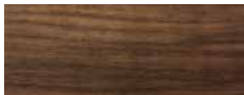
NOCE · WALNUT · NUSSBAUM · NOYER · NOGAL