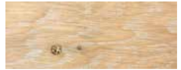
ROVERE CON NODI SBIANCATO CERA · WHITENED OAK WITH KNOTS WAX · EICHE MIT KNOTEN GEWEISST UND GEWACHST · CHÊNE AVEC NŒUDS BLANCHI CIRE · ROBLE CON NUDOS BLANQUEADO Y ACABADO CERA