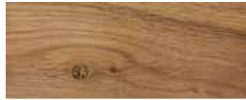
ROVERE CON NODI · OAK WITH KNOTS · EICHE MIT KNOTEN · CHÊNE AVEC NŒUDS · ROBLE CON NUDOS