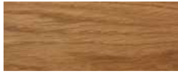
ROVERE · OAK · EICHE · CHÊNE · ROBLE