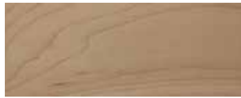
ACERO · MAPLE · AHORN · ÉRABLE · ARCE