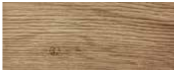
ROVERE CON NODI VINTAGE · VINTAGE OAK WITH KNOTS · EICHE MIT KNOTEN VINTAGE · CHÊNE AVEC NŒUDS VINTAGE · ROBLE CON NUDOS VINTAGE