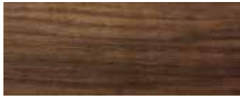
NOCE · WALNUT · NUSSBAUM · NOYER · NOGAL