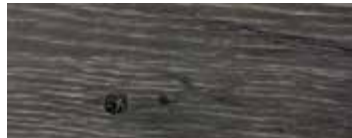
* ROVERE CON NODI PIGMENTATO GRIGIO CENERE · ASH GREY PIGMENTED OAK WITH KNOTS · EICHE MIT KNOTEN GRAU ASCHIG PIGMENTIERT · CHÊNE AVEC NŒUDS PIGMENTÉ GRIS CENDRÉ · ROBLE CON NUDOS PIGMENTADO GRIS CENIZA