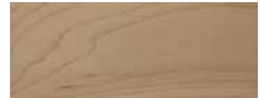
ACERO · MAPLE · AHORN · ÉRABLE · ARCE