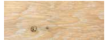
ROVERE CON NODI SBIANCATO CERA · WHITENED OAK WITH KNOTS WAX · EICHE MIT KNOTEN GEWEISST UND GEWACHST · CHÊNE AVEC NŒUDS BLANCHI CIRE · ROBLE CON NUDOS BLANQUEADO Y ACABADO CERA