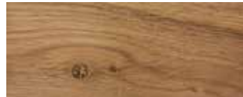
ROVERE CON NODI · OAK WITH KNOTS · EICHE MIT KNOTEN · CHÊNE AVEC NŒUDS · ROBLE CON NUDOS