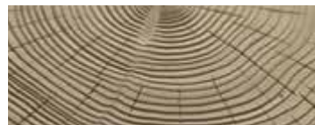
CEDRO SABBIAIO · SANDBLASTED CEDAR · ZEDER SANDGESTRAHLT · CÈDRE SABLÉ CEDRO ARENADO