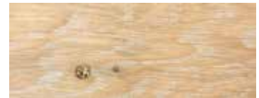
ROVERE CON NODI SBIANCATO CERA · WHITENED OAK WITH KNOTS WAX · EICHE MIT KNOTEN GEWEISST UND GENACHIST · CHÊNE AVEC NŒUDS BLANCHI CIRE · ROBLE CON NUDOS BLANQUEADO Y ACABADO CERA