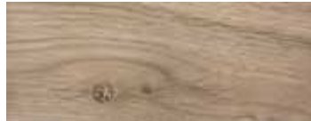
* ROVERE CON NODI PIGMENTATO BIANCO LATTE · WHITE MILK PIGMENTED OAK WITH KNOTS · EICHE MIT KNOTEN MILCHWEISS PIGMENTIERT · CHÊNE AVEC NŒUDS PIGMENTÉ BLANC LAITEUX · ROBLE CON NUDOS PIGMENTADO BLANCO LECHE