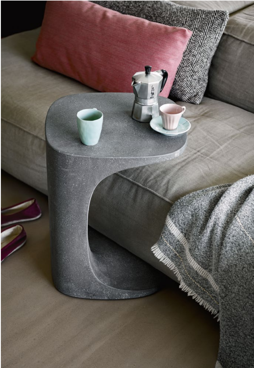
Font occasional table Cement