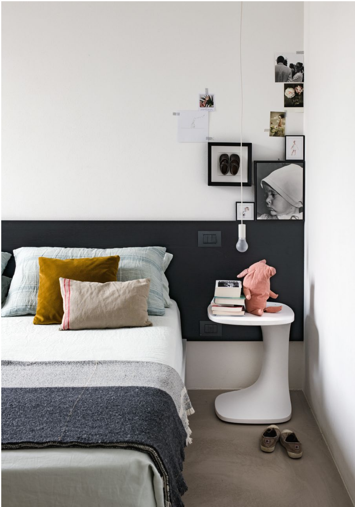
Font occasional table Cristalplant®