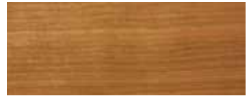
CLIEGIO · CHERRY · KIRSCHBAUM · MERISIER · CEREZO