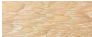
ROVERE SBIANCATO CERA · WHITENED OAK WAX · EICHE GEWEISST UND GEWACHST CHÊNE BLANCHI ET CIRE · ROBLE BLANQUEADO Y ACABADO CERA