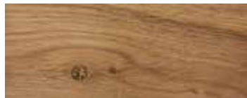
ROVERE CON NODI · OAK WITH KNOTS · EICHE MIT KNOTEN · CHÊNE AVEC NŒUDS ROBLE CON NUDOS