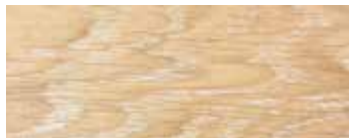
ROVERE SBIANCATO CERA · WHITENED OAK WAX · EICHE GEWEISST UND GEWACHST CHÊNE BLANCHÉ ET CIRÉ · ROBLE BLANQUEADO Y ACABADO CERA