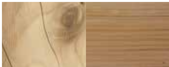
CEDRO, EFFETTO PIALLATO CEDAR, HAND SANDED EFFECT ZEDER, HANDEGEWOBELTER EFFEKT CÈDRE, EFFET TRABOTÉ CEDRO, EFECTO LIJADO A MANO