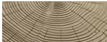
CEDRO SABBIAITO · SANDBLASTED CEDAR · ZEDER SANDGESTRAHLT · CÈDRE SABLE CEDRO ARENADO