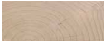
CEDRO CONTRACT · CEDAR CONTRACT FINISHING · ZEDER CONTRACT AUSFÜHRUNG CÈDRE FINITION CONTRACT · CEDRO ACABADO CONTRACT