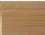
SEDUTA LEVIGATA SMOOTHED SEAT GESCHLIFFENE SITZ OBERFLÄCHE ASSISE PONCÉE ASENTO LIJADO A MÁQUINA