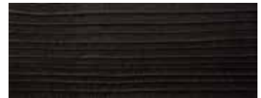
CEDRO VULCANO · VULCANO CEDAR · ZEDER VULCANO · CÈDRE VULCANO CEDRO VULCANO

SGABELLO IMPILABILE STACKABLE STOOL STAPELBARER HÖCKER TABOURET EMPILABLE TABURETE APILABLE