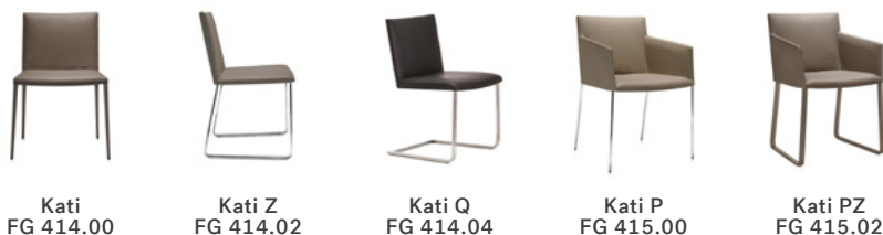
Kati FG 414.00