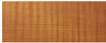
KAURI PIALLATO · HAND SANDED KAURI · KAURI HANDGESCHLIFFEN KAURI RABOTE · KAURI LLIADO A MANO

VERSIONE STANDARD: BASE IN FERRO NATURALE, FINITURA A OLIO · A RICHIESTA: BASE IN FERRO LACCATO · COLORE OPACO (SOLO COLORI RAL SELEZIONATI) / "IRONDUST" (GRIGIO ANTRACITE) · EFFETTO RAME ANTICO SPAZZOLATO OPACO · EFFETTO BRONZO ANTICO SPAZZOLATO OPACO · EFFETTO ACCIAIO SPAZZOLATO OPACO · EFFETTO TITANIO SPAZZOLATO OPACO