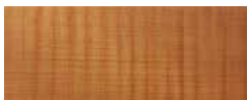
KAURI PALLATO · HAND SANDED KAURI · KAURI HANDGESCHLIFFEN KAURI RABOTÉ · KAURI LUJADO A MANO

VERSIONE STANDARD: BASE IN FERRO NATURALE. FINITURA TRASPARENTE OPACO · A RICHIESTA: BASE IN FERRO LACCATO · COLORE OPACO (SOLO COLORI RAL SELEZIONATI) / "IRONDUST" (GRIGIO ANTRACITE) · EFFETTO RAME ANTICO SPAZZOLATO OPACO · EFFETTO BRONZO ANTICO SPAZZOLATO OPACO · EFFETTO ACCIAIO SPAZZOLATO OPACO · EFFETTO TITANIO SPAZZOLATO OPACO