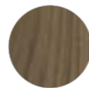
noce canaletto canaletto walnut