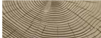
CEDRO SABBATO · SANDBLASTED CEDAR · ZEDER SANDGESTRAHLT · CÈDRE SABLÉ CEDRO ARENADO