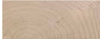
CEDRO CONTRACT · CEDAR CONTRACT FINISHING · ZEDER CONTRACT AUSFÜHRUNG CÈDRE FINITION CONTRACT · CEDRO ACABADO CONTRACT