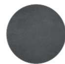
allunga extender ceramica grigia grey ceramic