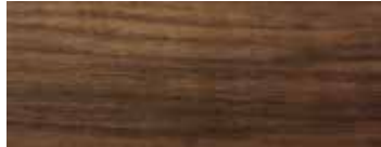
NOCE - WALNUT - NUSSBAUM - NOYER - NOGAL