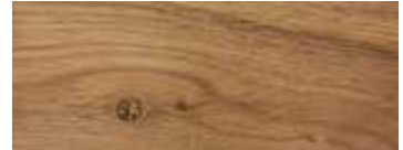
ROVERE CON NODI - OAK WITH KNOTS - EICHE MIT KNOTEN - CHÊNE AVEC NŒUDS - ROBLE CON NUDOS