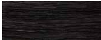
ROVERE CON NODI VULCANO A LISTE NON INCOLLATE - VULCANO OAK WITH KNOTS, PLANKS NOT GLUED - EICHE MIT KNOTEN VULCANO, BRETTER NICHT VERLEIMT - CHÊNE AVEC NŒUDS VULCANO, EN LATTES DISJOINTES - ROBLE CON NUDOS VULCANO, A LISTONES NO PEGADOS