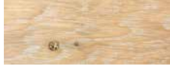
ROVERE CON NODI SBIANCATO CERA - WHITENED OAK WITH KNOTS WAX - EICHE MIT KNOTEN GEWEISST UND GEWÄCHST - CHÊNE AVEC NŒUDS BLANCHI CIRE - ROBLE CON NUDOS BLANQUEADO Y ACABADO CERA