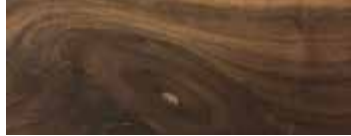
NOCE CON NODI - WALNUT WITH KNOTS - NUSSBAUM MIT KNOTEN - NOYER AVEC NŒUDS - NOGAL CON NUDOS