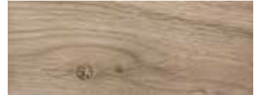
ROVERE CON NODI PIGMENTATO BIANCO LATTE - WHITE MILK PIGMENTED OAK WITH KNOTS - EICHE MIT KNOTEN MILCHWEISS PIGMENTIERT - CHÊNE AVEC NŒUDS PIGMENTÉ BLANC LAITELX - ROBLE CON NUDOS PIGMENTADO BLANCO LECHE