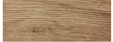
ROVERE CON NODI VINTAGE - VINTAGE OAK WITH KNOTS - EICHE MIT KNOTEN VINTAGE - CHÊNE AVEC NŒUDS VINTAGE - ROBLE CON NUDOS VINTAGE