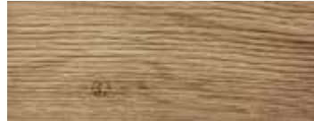
ROVERE CON NODI VINTAGE - VINTAGE OAK WITH KNOTS - EICHE MIT KNOTEN VINTAGE - CHÊNE AVEC NŒUDS VINTAGE - ROBLE CON NUDOS VINTAGE