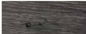
ROVERE CON NODI PIGMENTATO GRIGIO CENERE - ASH GREY PIGMENTED OAK WITH KNOTS - EICHE MIT KNOTEN GRAU ASCHIGE PIGMENTIERT - CHÊNE AVEC NŒUDS PIGMENTÉ GRIS CENDRE - ROBLE CON NUDOS PIGMENTADO GRIS CENIZA