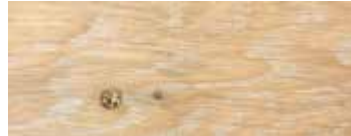
ROVERE CON NODI SBIANCATO CERA - WHITENED OAK WITH KNOTS WAX - EICHE MIT KNOTEN GEWEISST UND GEWÄCHST - CHÊNE AVEC NŒUDS BLANCHI CIRE - ROBLE CON NUDOS BLANQUEADO Y ACABADO CERA