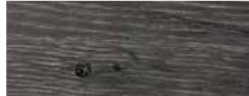
ROVERE CON NODI PIGMENTATO GRIGIO CENERE - ASH GREY PIGMENTED OAK WITH KNOTS - EICHE MIT KNOTEN GRAU ASCHIGE PIGMENTIERT - CHÊNE AVEC NŒUDS PIGMENTÉ GRIS CENDRE - ROBLE CON NUDOS PIGMENTADO GRIS CENIZA