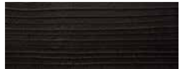
CEDRO VULCANO A LISTE NON INCOLLATE - VULCANO CEDAR, PLANKS NOT GLUED - ZEDER VULCANO, BRETTER NICHT VERLEIMT - CÈDRE VULCANO, EN LATTES DISJOINTES - CEDRO VULCANO, A LISTONES NO PEGADOS

VERSIONE STANDARD: BASE IN FERRO NATURALE, FINITURA A OLIO - A RICHIESTA: BASE IN FERRO LACCATO - COLORE OPACO (SOLO COLORI RAL SELEZIONATI) / "IRONDUST" (GRIGIO ANTRACITE) - EFFETTO RAME ANTICO SPAZZOLATO OPACO - EFFETTO BRONZO ANTICO SPAZZOLATO OPACO - EFFETTO ACCIAIO SPAZZOLATO OPACO - EFFETTO TITANIO SPAZZOLATO OPACO