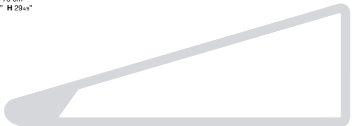
Leg section scale 1:1