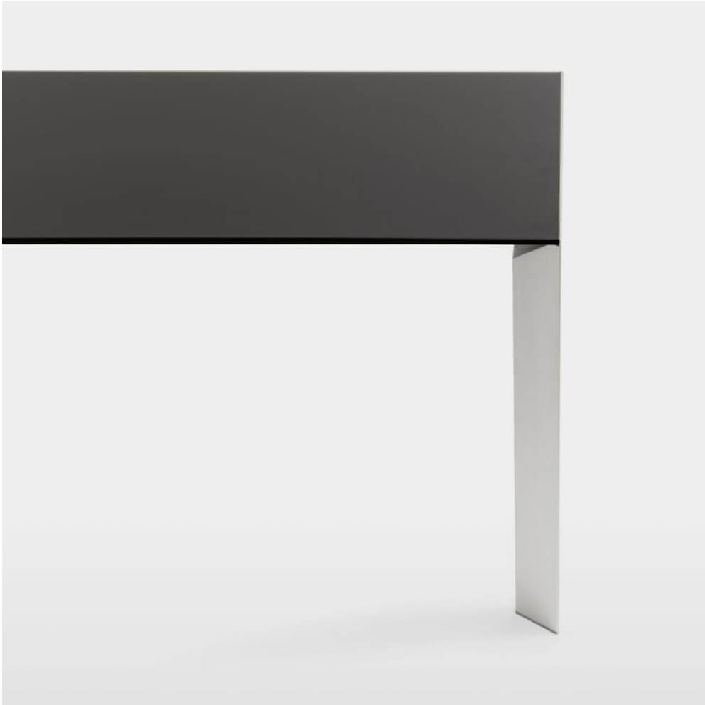
Nori table Matt glass top