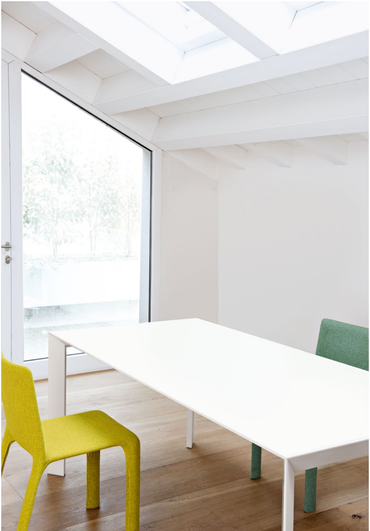
Nori table Pure-white laminate top