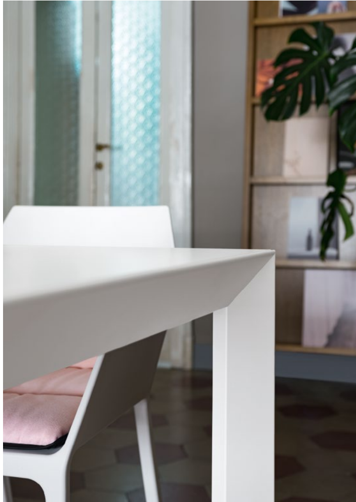
Nori table Pure-white laminate top