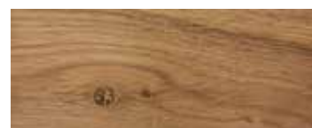
ROVERE CON NODI · OAK WITH KNOTS · EICHE MIT KNOTEN · CHÊNE AVEC NŒUDS · ROBLE CON NUDOS