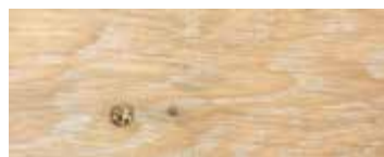
ROVERE CON NODI SBIANCATO CERA · WHITENED OAK WITH KNOTS WAX · EICHE MIT KNOTEN GEWEISST UND GEWACHST · CHÊNE AVEC NŒUDS BLANCHI CIRE · ROBLE CON NUDOS BLANQUEADO Y ACABADO CERA