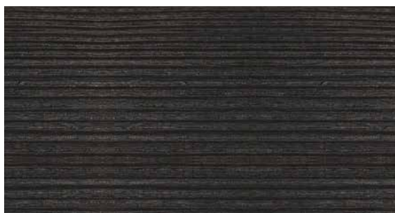
L038/L110 Rovere carbone impiallacciato | Charcoal oak veneer | Chêne fusain plaqué | Eiche Kohle furniert | Roble carbon chapado | Шпон дуба, уголь