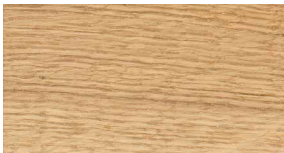
L109 Rovere naturale massello | Natural oak solid wood | Bois massif Chêne naturel | Massivholz Eiche natur | Roble natural macizo | Массив из натурального дуба

WOODS: solid/veener with solid wood edge/veener/lacquered | BOIS: massif/plaqué avec bords en bois massif/plaqué/laqué | HOLZ: Massivholz/furniert mit massiv Holz Rand/furniert/lackiert | MADERA: maciza/chapada con cantos en madera maciza/chapada/lacada | ДЕРЕВО: массив/шпон с краями из массива/шпон/лакированное