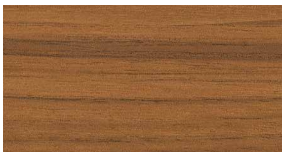
L036 Noce impiallacciato | Walnut veneer | Noyer plaqué | Nußbaum furniert | Nogal chapado | Шпон Орех