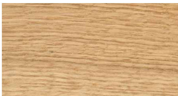
L009 Rovere naturale impiallacciato | Natural oak veneer | Chêne naturel plaqué | Eiche Natur furniert | Roble natural chapado | Шпон из натурального дуба