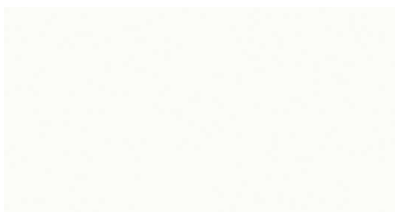
L079 Bianco | White | Blanc | Weiß | Blanco | Белый