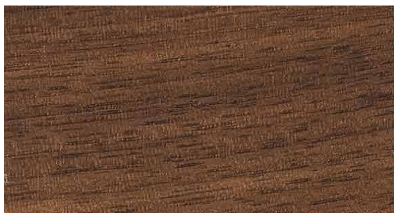
L006 Noce massello | Walnut solid wood | Bois massif Noyer | Nogal macizo | Massiv Nussbaum | Массив из ореха