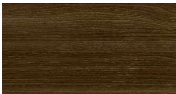
L002 Rovere Spessart impiallacciato | Spessart oak veneer | Chêne Spessart plaqué | Eiche Spessart furniert | Roble Spessart chapado | Шпон из дуба Spessart