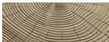
CEDRO SABBATO · SANDBLASTED CEDAR · ZEDER SANDGESTRAHLT · CÈDRE SABLE CEDRO ARENADO