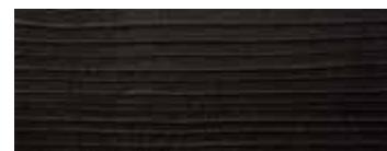
CEDRO VULCANO · VULCANO CEDAR · ZEDER VULCANO · CÈDRE VULCANO CEDRO VULCANO

VERSIONE STANDARD: BASE IN FERRO NATURALE, FINITURA A OLIO · A RICHIESTA: BASE IN FERRO LACCATO · COLORE OPACO (SOLO COLORI RAL SELEZIONATI) / "IRONDUST" (GRIGIO ANTRACITE) · EFFETTO RAME ANTICO SPAZZOLATO OPACO · EFFETTO BRONZO ANTICO SPAZZOLATO OPACO · EFFETTO ACCIAIO SPAZZOLATO OPACO · EFFETTO TITANIO SPAZZOLATO OPACO