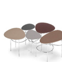
Viae 5 FG 484.00